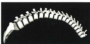
3-D Darstellung am Bsp. Flexion